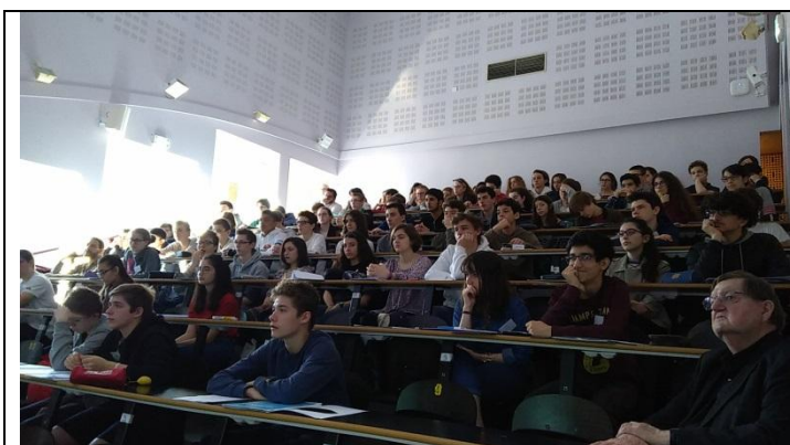
Le groupe à Versailles